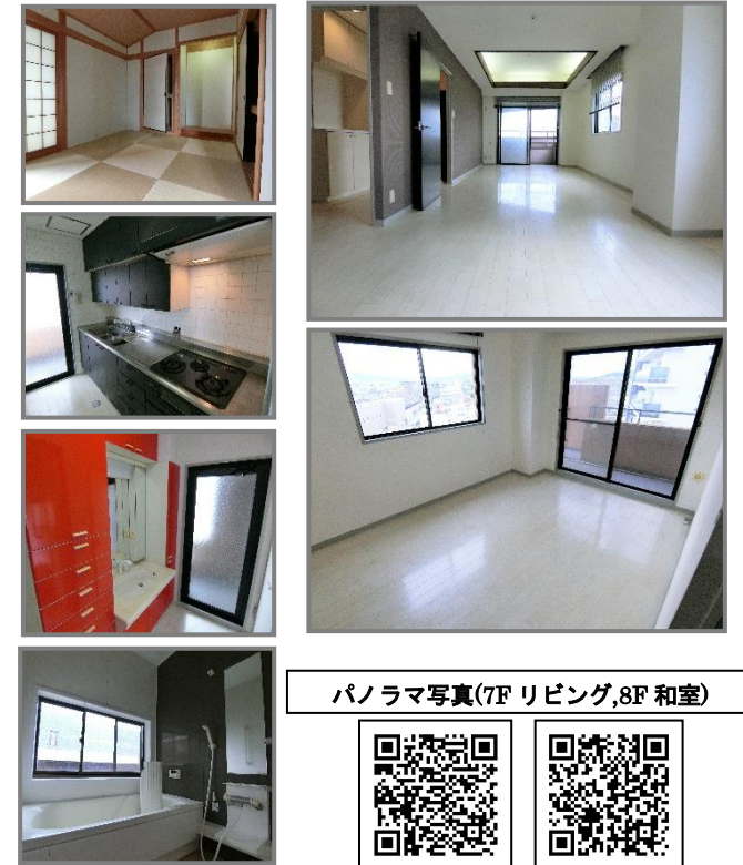
パノラマ写真(7Fリビング,8F和室)