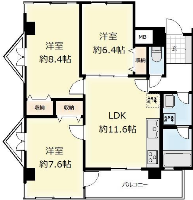
【804号室】設備入替予定